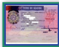
titre de séjour